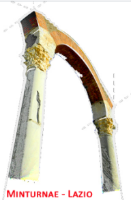
MINTURNAE - LAZIO